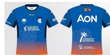
Camiseta árbitro azul 30,00€