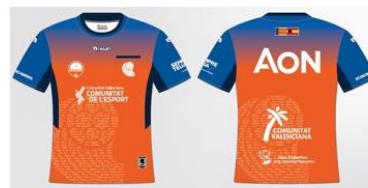
Camiseta árbitro naranja 30,00€