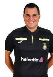
Jose M. Iniesta