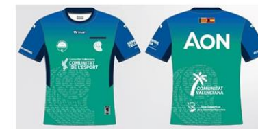
Camiseta árbitro verde 30,00€