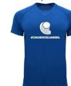
Camiseta técnica calentamiento/paseo 10,00€