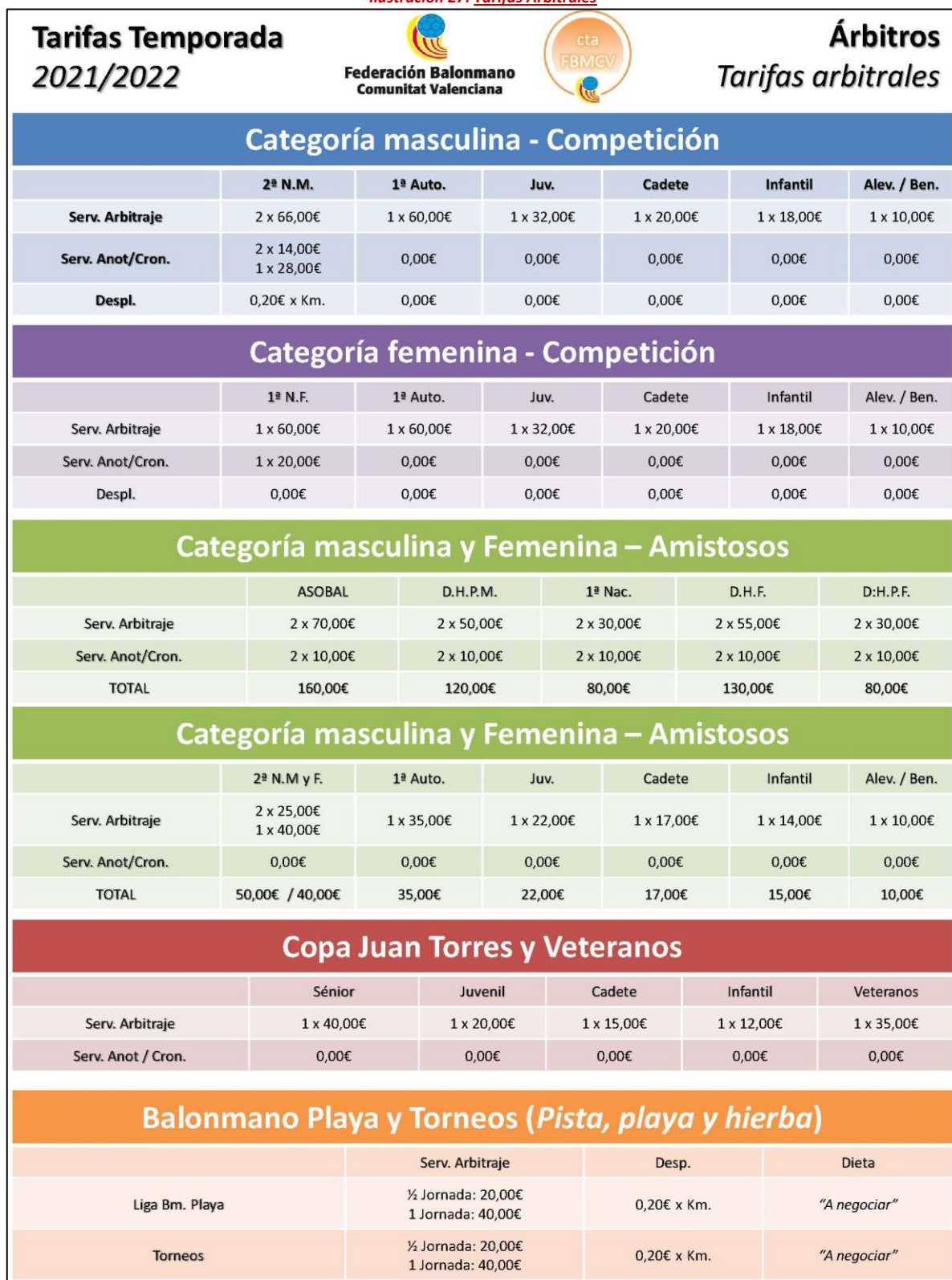
Ilustración 27: Tarifas Arbitrales